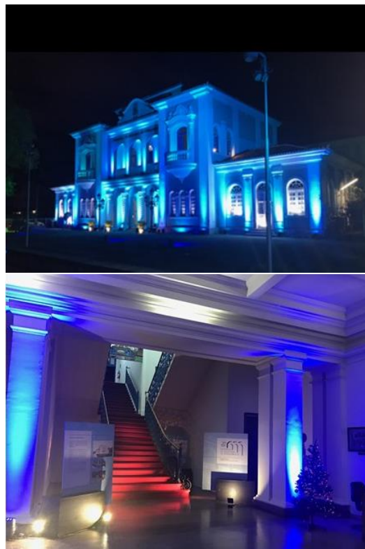
Figura 8. Painel superior: Memorial da Medicina de Pernambuco iluminado na noite do dia 19 de dezembro de 2018 na posse da nova Diretoria da Academia Pernambucana de Medicina. Painel inferior: escada com o novo carpete vermelho.

Muito do que foi escrito foi baseado da informação obtida na leitura de algumas referências. 1-7