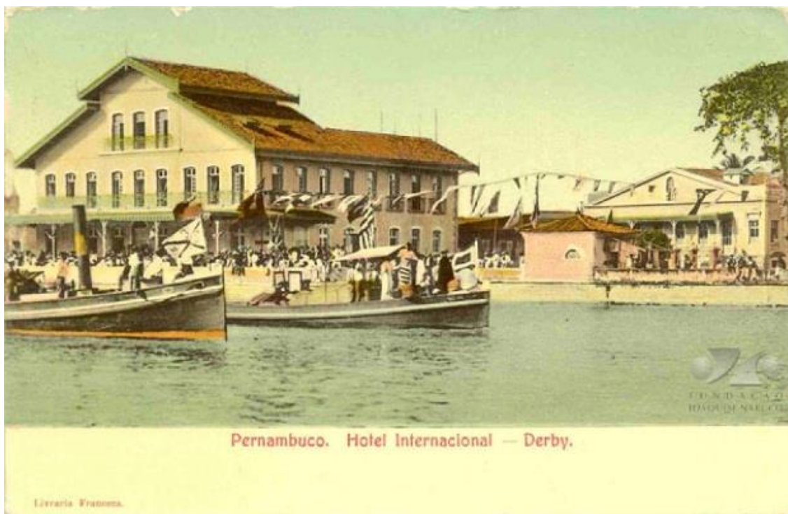
Figura 3. Foto do Hotel de Belmiro Gouveia com barcos navegando o Rio Capibaribe.