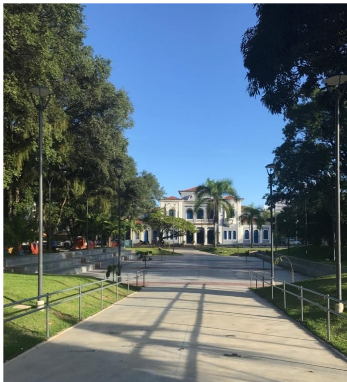
Figura 1. Memorial de Medicina de Pernambuco visto da Praça Octavio de Freitas em 30 de maio de 2019.