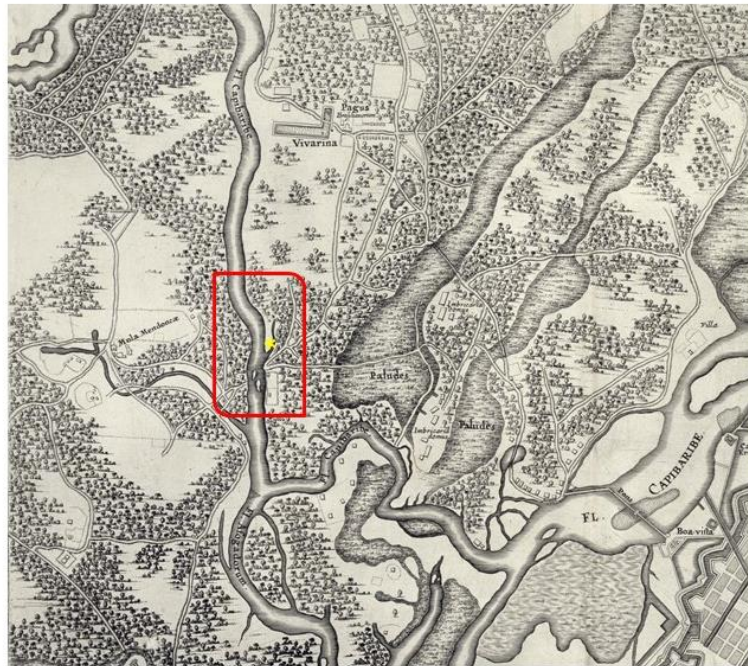
Figura 6. Mapa de 1639 mostrando o local onde hoje se localiza o Memorial da Medicina de Pernambuco, construído provavelmente em área que pertencia à estância de Henrique Dias, herói negro da Insurreição Pernambucana (Guerra da Luz Divina), que parece ter ganhado do rei de Portugal pelos serviços militares. Nota-se a presença de duas ilhas fluviais nas proximidades da passagem da Madalena, o que pode ter facilitado a travessia sobre o Rio Capibaribe. Há uma convergência de caminhos para o local das ilhas.

Em 1898 Delmiro Gouveia arrenda o Prado do Derby e constrói um grande mercado público – Mercado Modelo Coelho Cintra – que foi inaugurado em 7 de setembro de 1899. Alguns falam que foi o primeiro Shopping Center do Brasil, pela construção monumental para a época, inclusive com luz elétrica. Porém, sua existência foi curta, no segundo dia de janeiro de 1900 um incêndio criminoso destruiu toda a estrutura. Foi restaurado em 1924 e passa a ser a sede do Comando da Polícia Militar do Estado de Pernambuco.