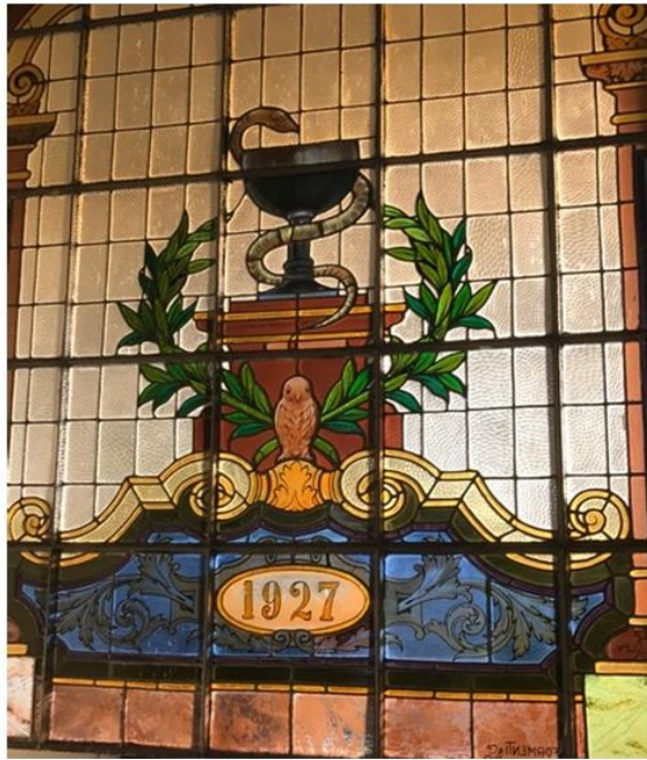
Figura 7. Vitrail no Memorial da Medicina de Pernambuco. Obra de arte do italiano Cesare Formenti.

Em 1841, a Sociedade de Medicina de Pernambuco foi criada, reunindo médicos formados em outros estados ou na Europa, cirurgiões e farmacêuticos.