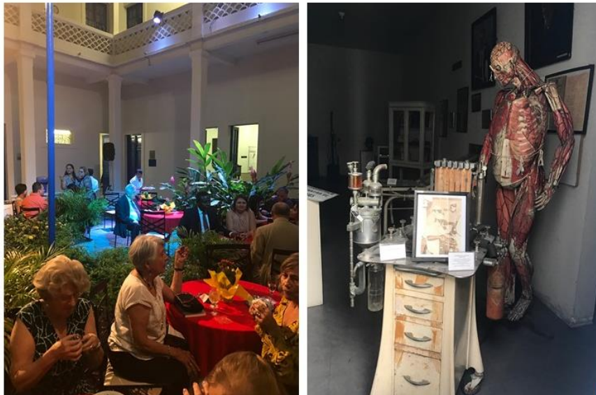
Figura 9. Confraternização após a cerimônia de posse da nova Diretoria da Academia Pernambucana de Medicina no dia 19 de dezembro de 2018 (esquerda) e detalhe de algumas peças do Museu da Medicina do Instituto Pernambucano da História da Medicina (direita).